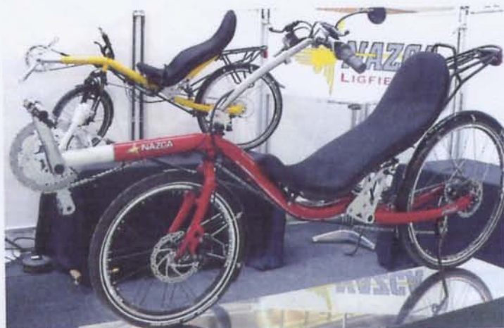
Eine kürzere und feuerrote Ausführung des Nazca »Fuego« – für die Kunden ab 1,60 Meter Körpergröße.

Auf der Spezi stand noch ein Prototyp des neuen Gaucho von Nazca , ein komplett neues 2x26-Zoll-Liegerad, sportlicher und trotzdem höher liegend.