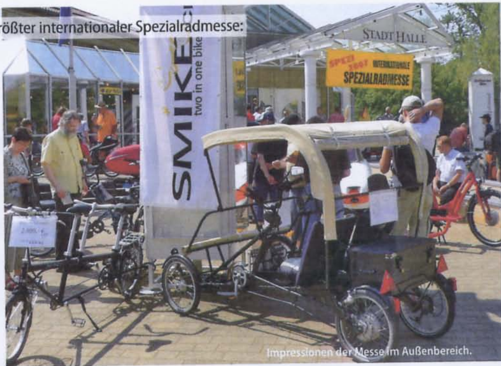
Impressionen der Messe im Außenbereich.

Germersheim, 28. und 29. April: 8.000 Menschen besuchten die internationale Spezialradmesse 2007. Sie fand in und vor drei städtischen Messehallen statt. Zehn Prozent mehr Besucher führt Initiator Hardy Siebecke auf die professionelle Pressearbeit zurück.